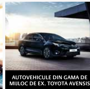
AUTOVEHICULE DIN GAMA DE MIJLOC DE EX. TOYOTA AVENSIS